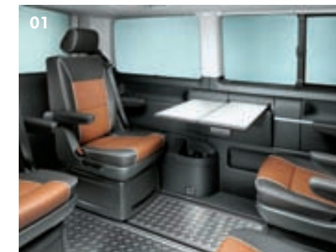
01 Versenkbarer Klapptisch in der Seitenwand 02 Geräumiger Kofferraum 03 Einstiegsleuchte

Ob unterwegs in der staubigen Wüste Afrikas oder im modernen Großstadtdschungel der europäischen Metropolen – an jedem Ort der Welt überzeugt der Multivan PanAmericana durch sein elegantes Äußeres, das flexible Innenraumkonzept und seine intelligenten Details. So profitieren Sie von den Erfahrungen, die der Multivan PanAmericana auf seinem langen Weg durch die verschiedensten Kontinente gesammelt hat, auch dann, wenn Sie sich zur Abwechslung mal nur auf den Weg in die Innenstadt machen. Schließlich steckt im Multivan PanAmericana unsere über Jahre gesammelte On- und Offroad-Kompetenz. Und die überzeugt auch dann, wenn Sie mit Ihrer Frau oder Ihren besten Freunden nur ein paar Schnäppchen jagen möchten.